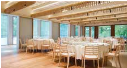
Restaurant Font Moixina