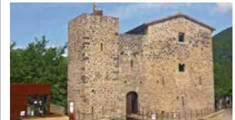
Castell de Juvinyà