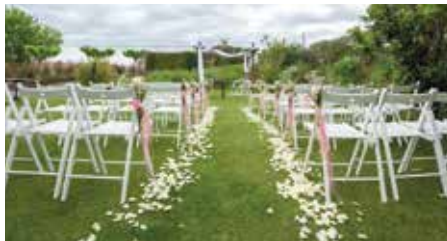
Restaurant Arcada de Fares