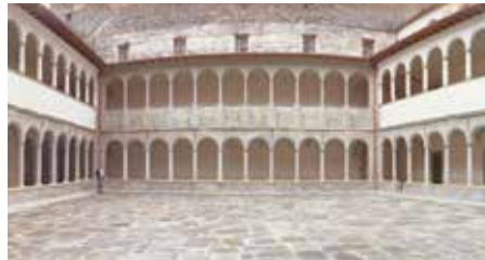
Claustre del Carme