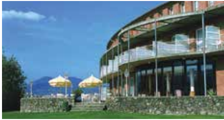
Hotel Riu Fluvia