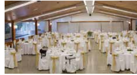
Restaurant La Deu