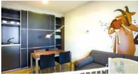
Hotel La Perla