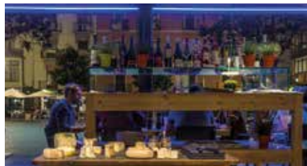
Restaurant Cafè Europa