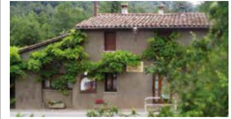
Restaurant Hostal dels Ossos