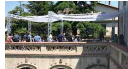
Museu dels Sants