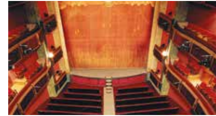
Teatre Principal d'Olot