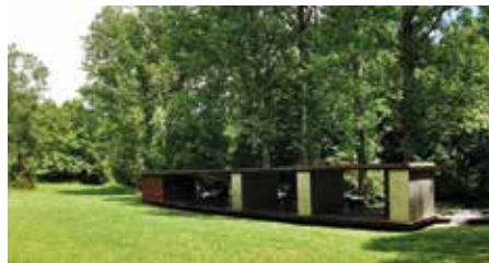
Pavelló de bany